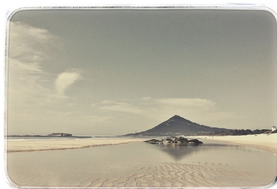
A PRAIA DE MOLEDO NO ÁLBUM DE POSTAIS DO ZILIÃO